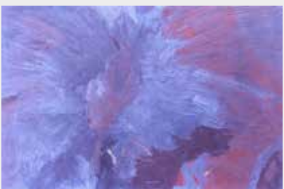
Tierra Óleo sobre madera 90 x 60 cm 2002