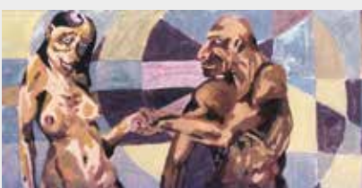
Pareja Óleo sobre madera 120 x 60 cm 2002