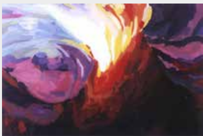
Volcán Óleo sobre madera 90 x 60 cm 2002