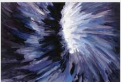
Tornado Óleo sobre madera 90 x 60 cm 2002