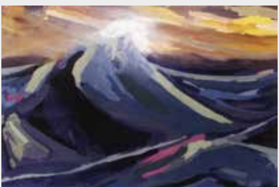
Ola Óleo sobre madera 90 x 60 cm 2002